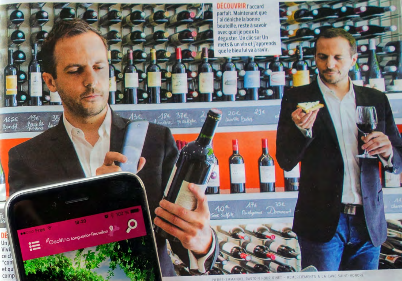
PIERRE-EMMANUEL RASTOIN POUR DINET - REMERCIEMENTS À LA CAVE SAINT-HONORE